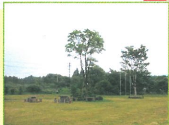
阿蘇子どもの文化の森