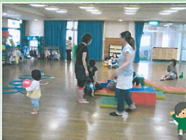
子育て支援 “のびのび”